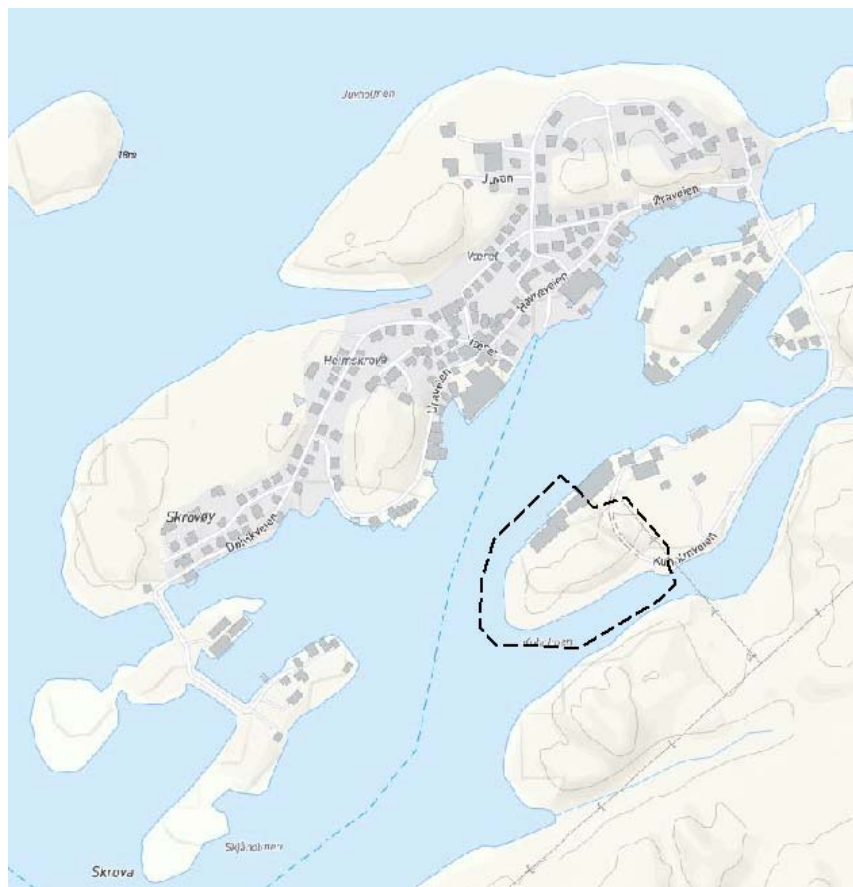
Figur 1 Oversiktskart med planområdet

Iht. plan- og bygningsloven § 12 – 8 varsles med dette at det igangsettes planarbeid for Kuholmen Området er i dag regulert til fiskebruk/industriområde i reguleringsplanen for Skrova øst. I kommuneplanens arealdel er området avsatt til bebyggelse og anlegg. Hensikten med planarbeidet er å legge til rette for etablering av et overnattingstilbud innenfor området. Reguleringsformålet antas å bli «hotell/overnatting».