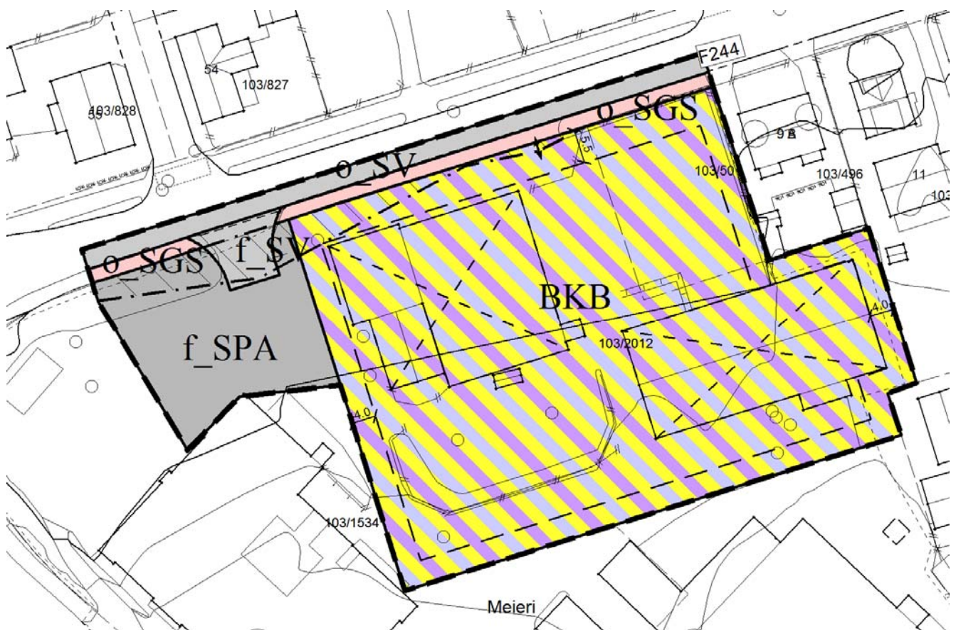
Figur 2 Planskisse varselsplanoppstart

Deler av gnr 103 bnr 1534 omfattes også av varsel om planoppstart, dette da området er regulert til felles adkomst/parkering. Dette arealet er tatt med da det er ønske om en noe bedre planavklaring av disse områdene.